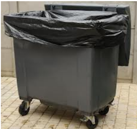
Poubelles à ordures ménagères

Déchets alimentaires – Barquettes polyester , aluminium ..... OU EN CAS DE DOUTE