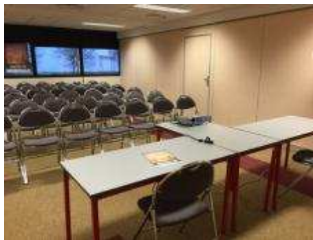
Salle du 1 er étage : configuration théâtre

1 écran dans les salles avec vidéoprojecteur