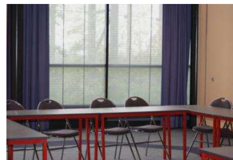
Salle 12 , situé au 2 ème étage