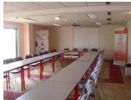
Salle du 1 er étage : configuration en U